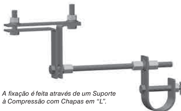
A fixação é feita através de um Suporte à Compressão com Chapas em “L”.