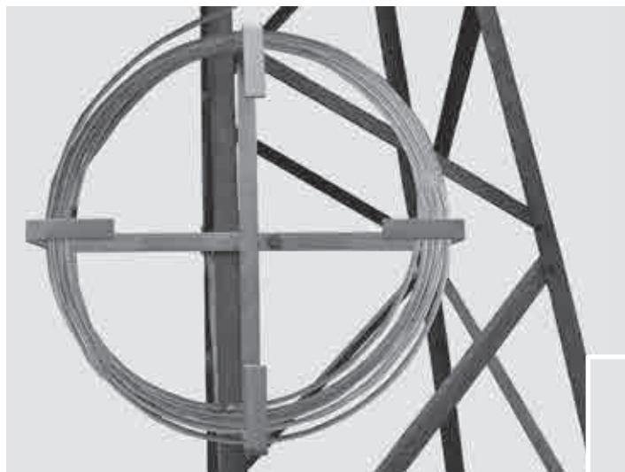
A fixação no montante ou na treliça da torre é feita através de um Suporte à Compressão com Chapas em “L”.