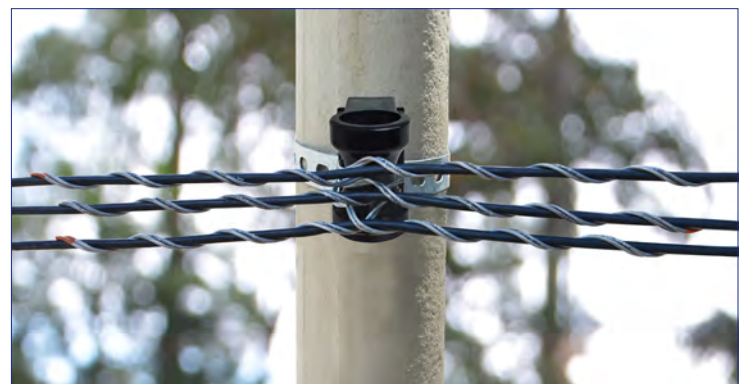
Suspensão com Laços Preformados