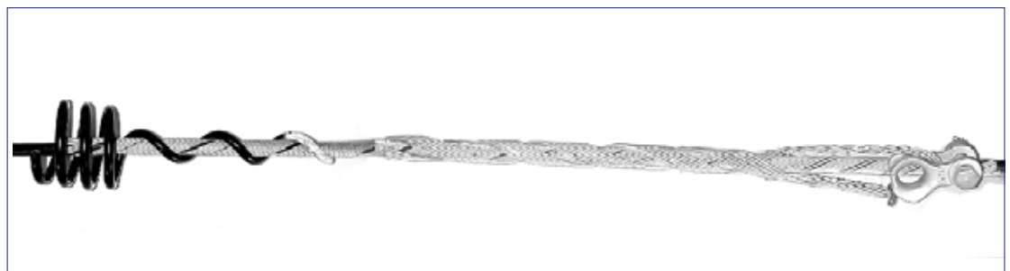
Corona Coil aplicada en el Conjunto de Retención Fiberlign - FDDE