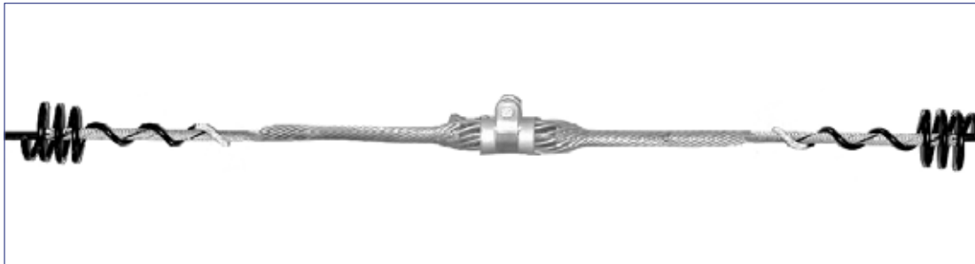
Corona Coil aplicada en la Grapa de Suspensión Fiberlign - AGSO