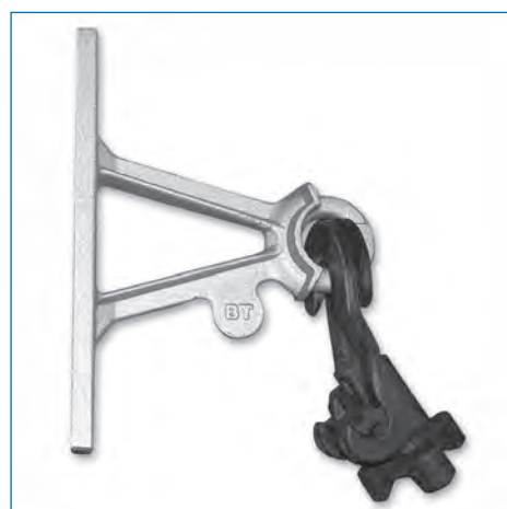
GSE-0502 - Para Redes Secundárias hasta 220 V.