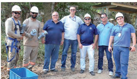
CPFL – Sorocaba, SP

Os testes de campo estão sendo monitorados e, até o momento, o desempenho dos Isoladores tem se apresentado satisfatório, além da ótima aceitação dos eletricitistas pela facilidade de aplicação e ajuda na parte ergonômica, pois reduz o esforço físico na aplicação.