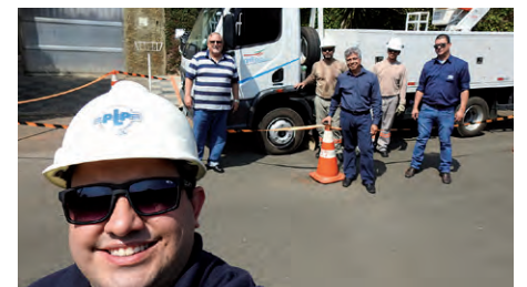
CPFL – Jaguariúna, SP