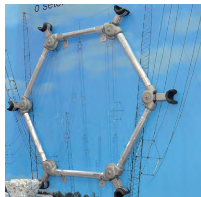
Espaçador Hexagonal de 800 kV CC