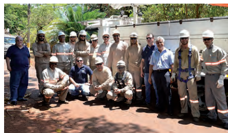
CPFL – Ribeirão Preto, SP