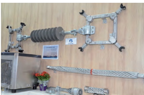
Separador de Fases, Emenda Preformada, entre outros

Na Expo SNPTEE, a PLP expôs seus principais produtos para Linhas de Transmissão de Energia Elétrica , com ênfase para o Separador de Fases , conjunto composto por Espaçador Amortecedor , Ferragens de Acoplamento e Isolador Polimérico , cuja função é evitar o choque entre fases em Linhas de Transmissão; a Esfera de Sinalização , que pode ser instalada por cordas ou robô; e o novo Espaçador Amortecedor Hexagonal para feixes expandidos, para LT de 800 kV CC.