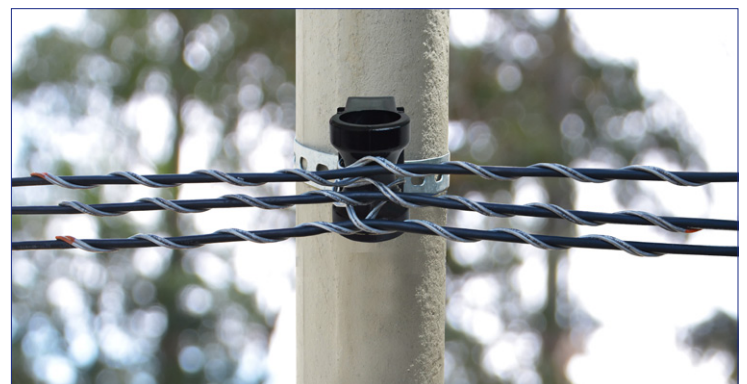
Suspensión con Ataduras Preformadas