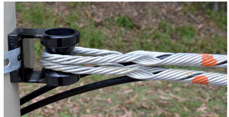
Anclaje con Retenciones Preformadas